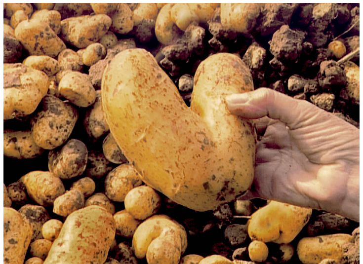
Les glaneurs et la glaneuse de Agnès Varda 2000, 82 minutes