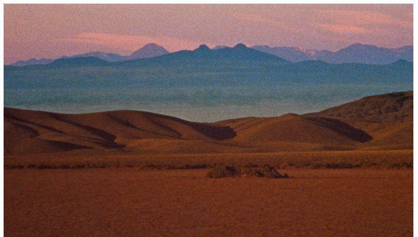
Altiplano de Malena Szlam 2018, 16 minutes