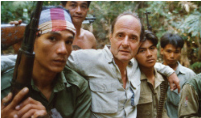
Petit Dieter doit voler de Werner Herzog 1997, 74 minutes