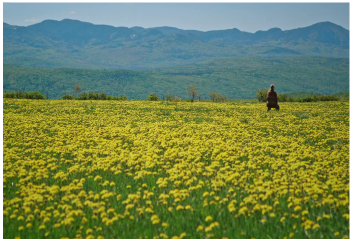
La fille du cratère de Danic Champoux & Nadine Beudet 2019, 76 minutes