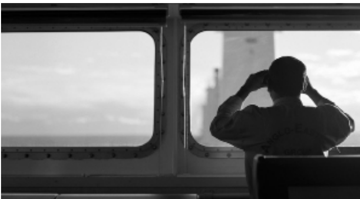
Transatlantique de Félix Dufour-Laperrière 2014, 71 minutes