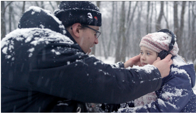
L'esprit des lieux de Serge Steyer & Stéphane Manchecatin 2018, 91 minutes