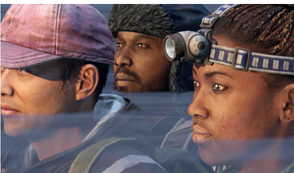
« Knit's Island, l'île sans fin » de Guilhem Causse, Ekiem Barbier & Quentin L'helgoualc'h