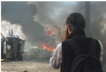
« Photographe de guerre » de Christian Frei