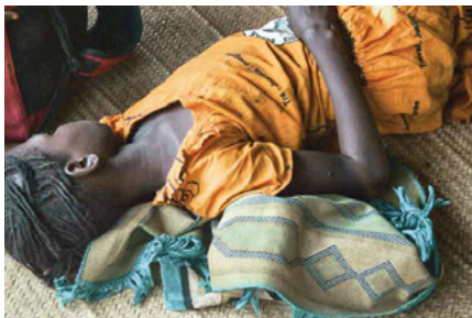
« Cahier africain » de Heidi Specogna