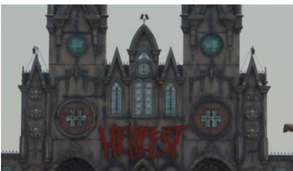
« Apocalypse » de Benoit Méry