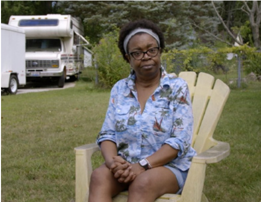
« Yours in Sisterhood » de Irene Lusztig

Ces films ont été dénichés par notre comité de programmation composé de 15 personnes en France, Suisse, Allemagne et Italie.