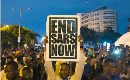
« Coconut Head Generation » de Alain Kassanda

Les films à emmener sur une île déserte. Ce sont ces œuvres qui marquent durablement la mémoire et s'imposent comme autant d'expériences vécues, de regards inoubliables.